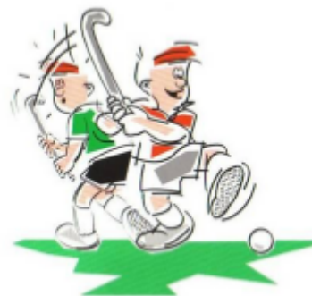
Het hoog spelen van de bal

Hakken: op de stick slaan van een tegenstander