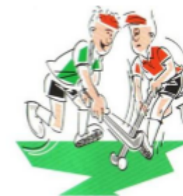
Het duwen van je tegenstander